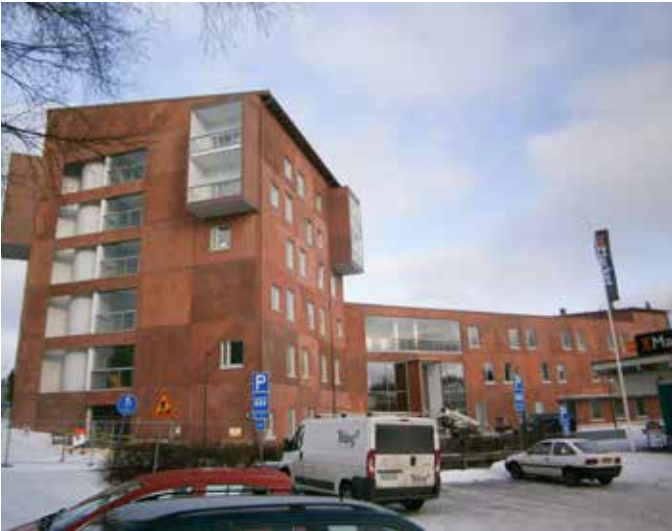
Järvenpään on valmistumassa energiatehokas ja maalämmöllä lämpenevä palvelutalo Vaahterakoti.

Järvenpään Jampassa on rakenteilla Järvenpään Mestariasuntojen ja Järvenpään kaupungin yhteishankkeena suunnittelema 74 asunnon Vaahterakoti. Kyseessä on senioreille tarkoitettu palvelutalo, jonka kaikki asunnot tulevat kaupungin järjestämän ympärivuorokautisen hoivapalvelun piiriin. Vaahterakoti on suunniteltu matalaenergiakerrostaloksi, ja rakennuksen lämmönlähteeksi tulee maalämpö. Rakennushanke aloitettiin syksyllä 2015, ja kohteen arvioitu valmistumisaika on keväällä 2017. Ensimmäiset asukkaat muuttivat Vaahterakotiin kuitenkin ja vuoden 2016 lopussa.