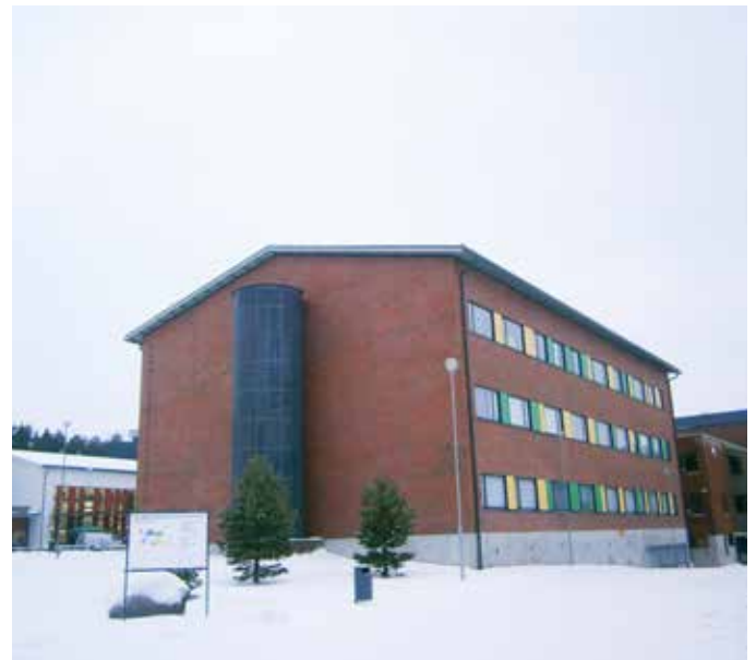
Nummelanharjun koulukeskus Vihdin Nummelassa sekä sen vieressä oleva uimahalli siirrettiin öljylämmityksestä hakelämpöön. Jatkossa uusiutuvan energian osuutta rakennusten lämmityksessä on tavoitteena Vihdissä lisätä edelleen.